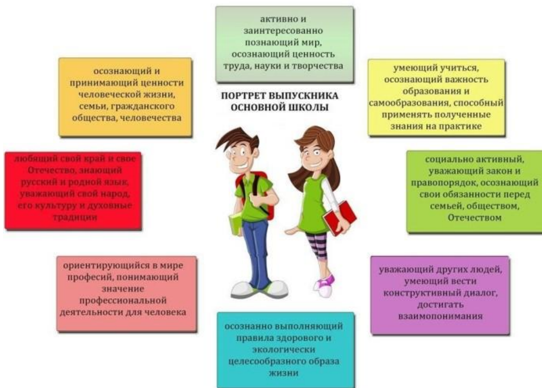
Модель выпускника средней школы